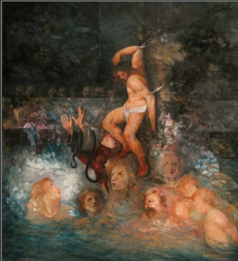
«Ανθρωπογονία» 2012 • ελαιογραφία σε λινό 101x111 cm

Το Ιταλικό Μορφωτικό Ινστιτούτο Θεσσαλονίκης παρουσιάζει την έκθεση του ζωγράφου Γιώργου Πολ. Ιωαννίδη με τίτλο: «ΠΡΟΜΗΘΕΩΝ ΤΟΠΟΙ»*