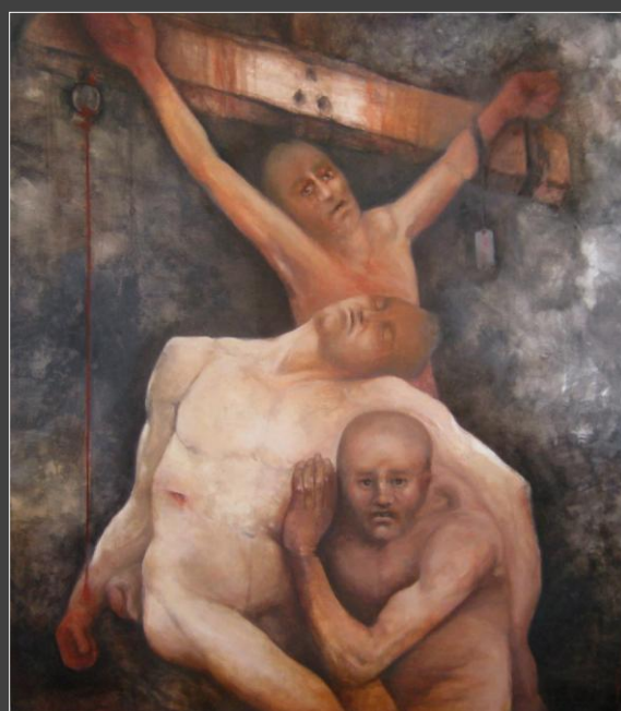
«Προμηθέων τόποι» 2013 ελαιογραφία σε λινό 95x105 cm